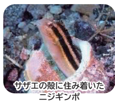
サザエの殻に住み着いた ニジギンボ

これと言って潜りにアドバイスはないかな～? 強いて言えば、目もカメラもマクロモードに切り替え、じっくり! じっくり! 岩の隙間、穴、暗礁の壁をこまかく探す。このコースを 80 分かけて潜るようになったら、越前 LOG 前マクロスペシャリストです。