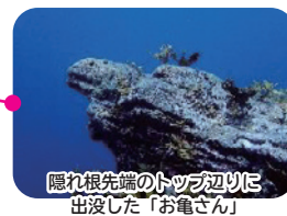
隠れ根先端のトップ辺りに 出沒した「お電さん」