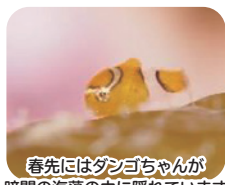
春先にはダンゴちゃんが 暗間の海藻の中に隠れています