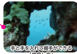
手と手を入れて握手ができる 「仲良し岩」