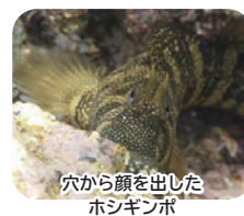
穴から顔を出した ホシギンボ