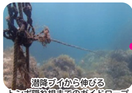
潜降ブイから伸びる トンボ隠れ根までのガイドロープ