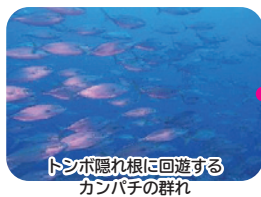
トンボ隠れ根に回遊する カンパチの群れ

潜降ブイより沖に進むと水深 5m→10m に一直線に落ちています。下ると直ぐにトンボ隠れ根までガイドロープが張ってあるため安心です。そこからは根の回りや根の上で遊べば迷うことなく帰ってこれます。 ※春先にはガイドロープがないので注意！！